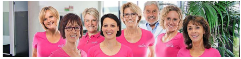
Der Weg zum Wunschgewicht: Mit dem Expertenteam von easylife ist es machbar!

Aktion bis 31. Mai: Figur- und Stoffwechselanalyse bei easylife